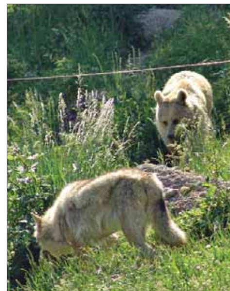
Besichtigung des neuen Bären- und Wolfgeheges im Natur- und Tierpark Goldau.