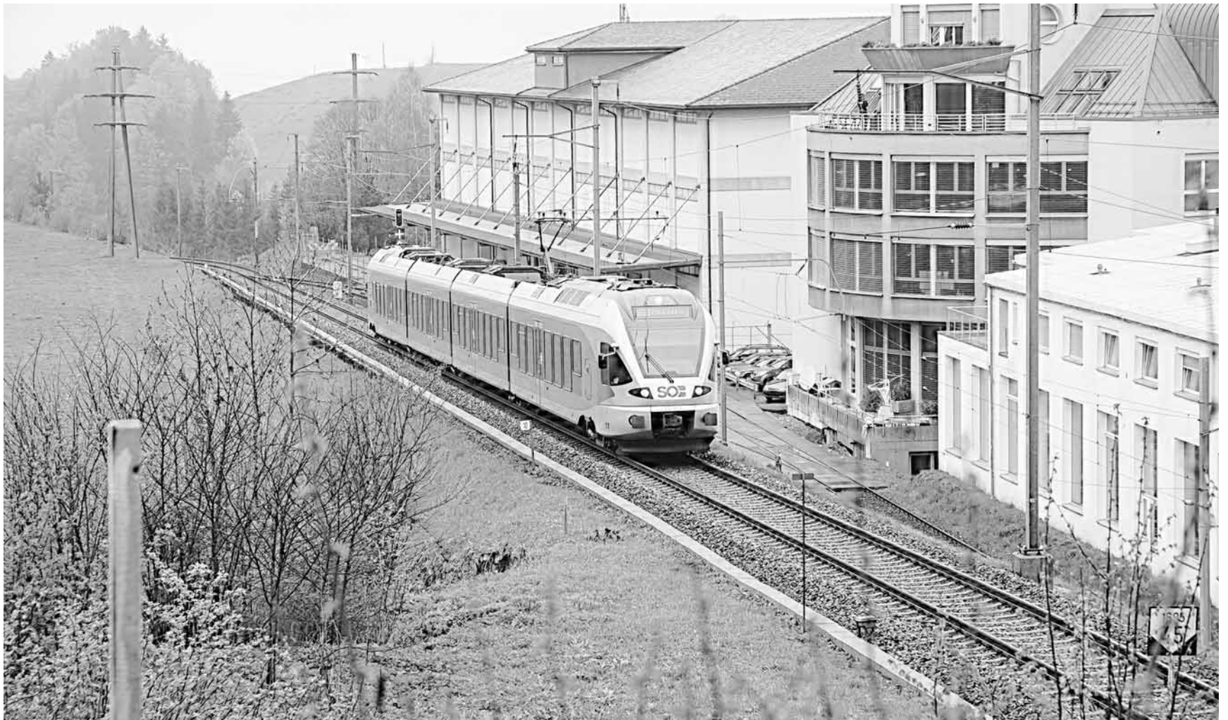
Der Wildschutzzaun wird zwischen der bestehenden Wildüberführung und Biberbrugg erstellt. Die Länge des Zauns beträgt rund einen Kilometer pro Seite. Der Zaun soll noch vor der Hirschbrunft errichtet werden.

2,2 Meter hoher Zaun Guido Schuler von Tiefbauamt sagte auf Anfrage, dass nun ein sogenanntes Notengitter (Maschendrahtzaun) mit einer Höhe von 2,2 Metern installiert