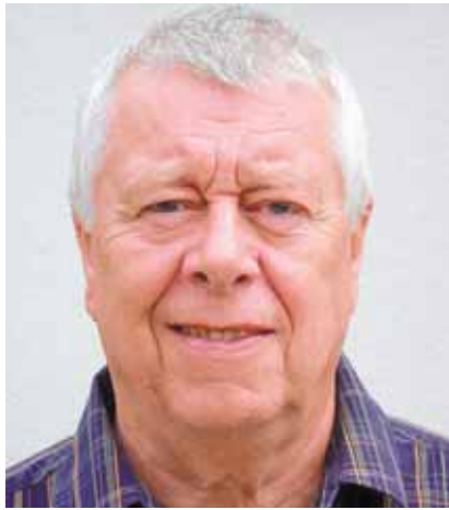
Von Geri Kühne

In einzelnen Kantonen haben sie bereits begonnen, die Schulferien. Ab Ende dieser Woche dürfen sich auch